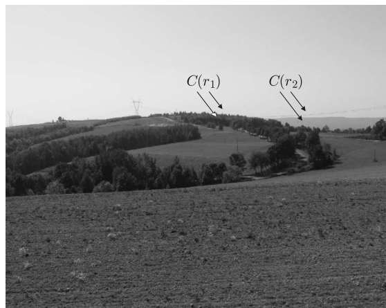
Rys. 2. Definiowanie kontrastu lasu dla dwóch pasm wzniesień w rejonie Podkarpacia.

Współczynnik ekstynkcji dla molekuł powietrza może być wyznaczony z przybliżonego wzoru