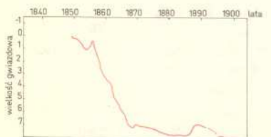
Rys. 2. Krzywa jasności \eta Car w II połowie XIX wieku.