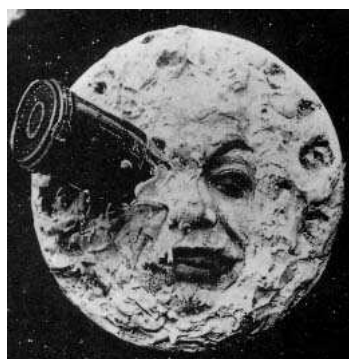
Kadr z filmu Georgesa Mélièsa pt. Podróż na Księżyc .

Przykłady interesujących pareidolii znajdziemy np. tu: http://www.netaxs.com/~mhmyers/mnillusion.html .