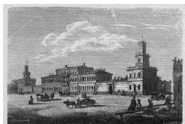
Dworzec kolei żelaznej warszawsko-wiedeńskiej w Warszawie

Początków kolei na ziemiach polskich możemy doszukiwać się na Górnym Śląsku, gdzie w latach 1798–1802 wybudowano wąskotorową konną kolej przemysłową, która połączyła Hutę Królewską pod Chorzowem z szybami kopalni Król . Natomiast pierwszą linią normalnotorową na obecnych ziemiach polskich było połączenie Wrocławia z Oławą oddane do użytku 22 maja 1842.