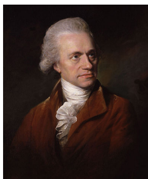
William Herschel (1738–1822)

*Instytut Matematyki Stosowanej i Mechaniki UW ** Wydział MIM UW